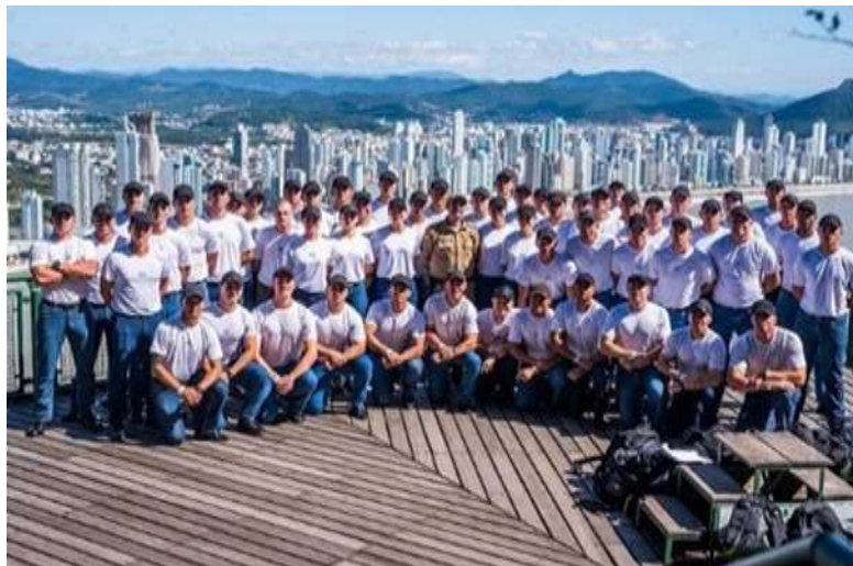
FORMATURA POLÍCIA MILITAR